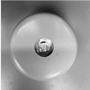
lampje bij licht