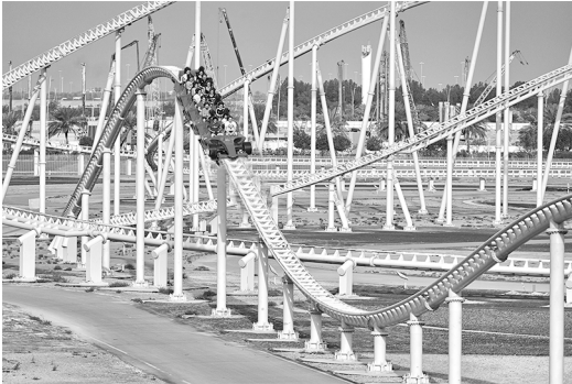
situatie 1: E_{bew} = 200 \text{ kJ}

Je ziet twee situaties van het treintje tijdens een rit met de bewegingsenergie op dat moment.