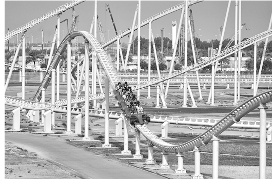
situatie 2: E_{bew} = 800 \text{ kJ}