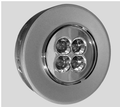
lamp met 4 leds